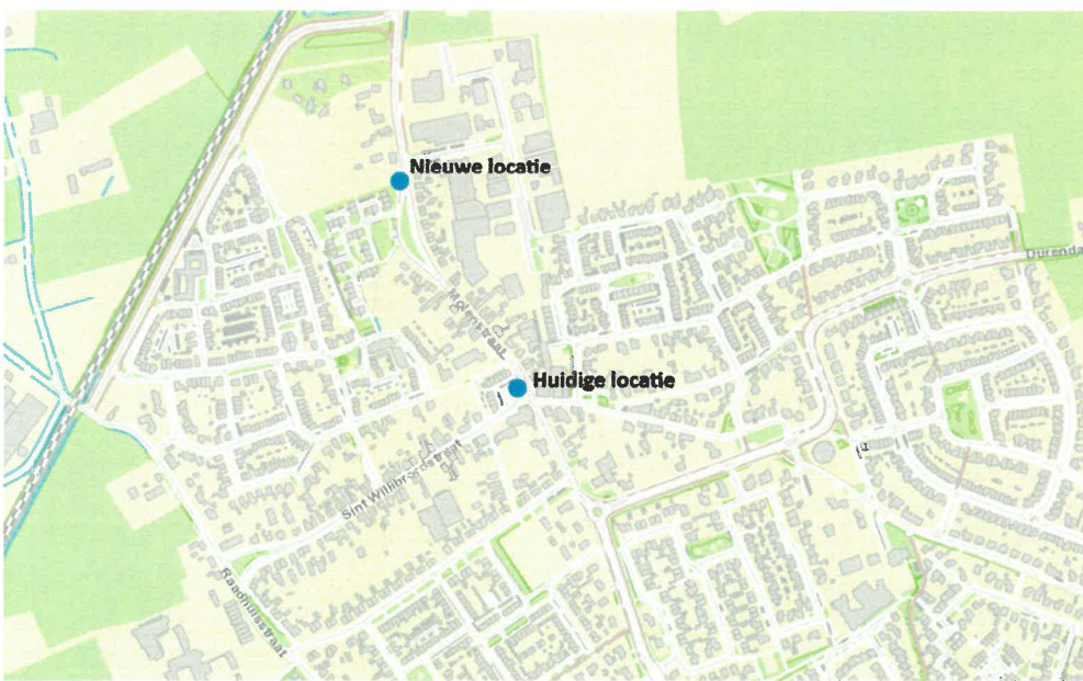
De nieuwe locatie van de bus aan de Molenstraat ligt ter hoogte van de Schorsmolen.